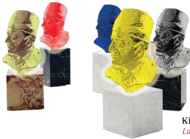
King on the Rock Lampe à poser