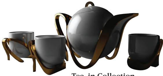
Tea-in Collection Teière