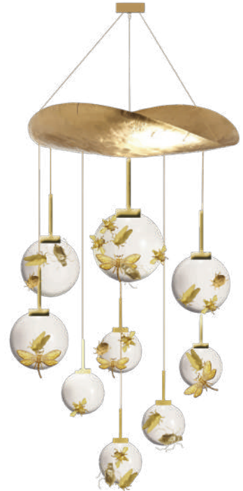
Bassin des Nymphéas Lustre