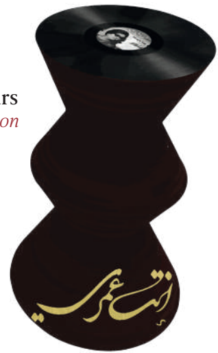
45 Tours Guéridon